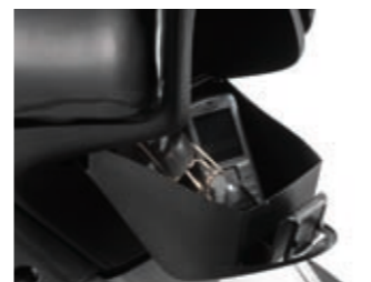
Pratico vano supplementare portaoggetti ricavato nel puntale della sella.