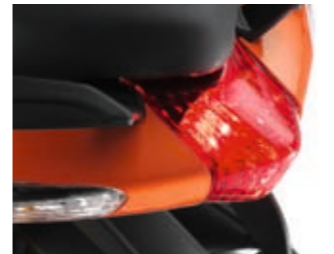
Gruppo ottico posteriore.