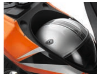
Vano sottosella che alloggia un casco integrale.

COME NON POTERNE APPREZZARE LE DOTAZIONI SUPERIORI: CRUSCOTTO DIGITALE MULTIFUNZIONE, DOPPIO PROIETTORE ANTERIORE CON LAMPADIE ALOGENE, BLOCCHETTI ELETTRICI DI TIPO MOTOCICLISTICO, ANTIFURTO CON TRANSPONDER. APPENA SR SARÀ TUO, LASCIACI SOPRA LA TUA IMPRONTA E PORTALO IN PIAZZA: SR AMA FARSI NOTARE. OVUNQUE.