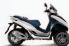
MP3 YOURBAN NRL