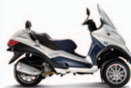
MP3 HYBRID LT