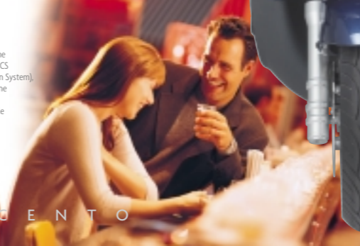
Radio RDS, interfono e connessione telefonica anche in scooter con PICS (Piaggio Integrated Communication System), l'avanzato sistema di comunicazione studiato da Piaggio per offrire a conducente e passeggero un utile e piacevole compagno di viaggio.