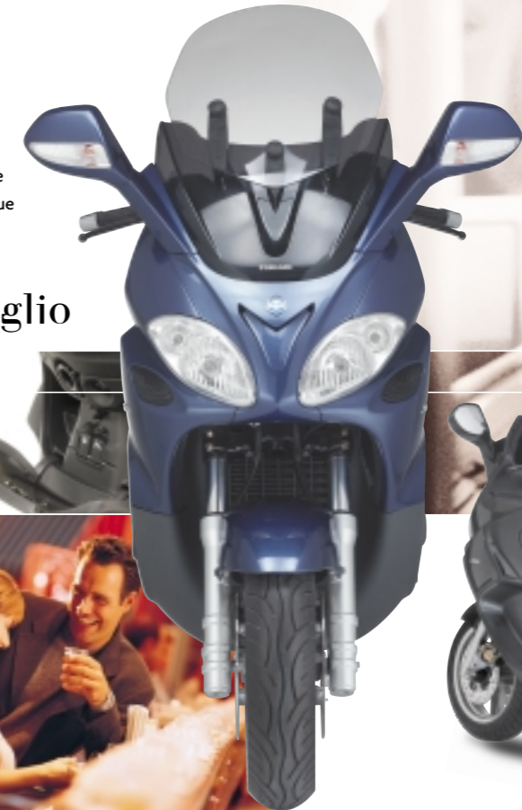
Parabrezza sdoppiato regolabile su 3 posizioni.