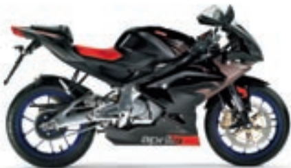
GP Aprilia White