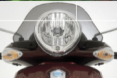
Lampada alogena di ampia parabola.

Beverly 500 è il piacere di muoversi in tutto comfort, dentro e fuori città. Agile e versatile, con lui puoi andare dove vuoi.