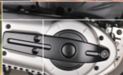
Motore Piaggio MASTER 500 da 39 CV, 4 valvole, catalizzato ad iniezione elettronica (rispetta i limiti EURO 2).