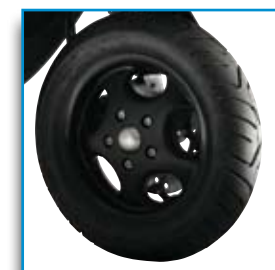
Cerchi da 10"