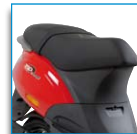
Comoda sella regolabile su tre posizioni