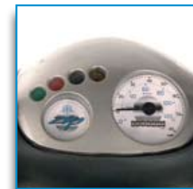
Cruscotto dal design accattivante