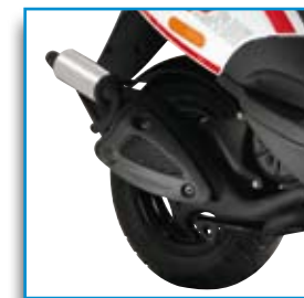
Paracalore marmitta nero dall'aspetto sportivo